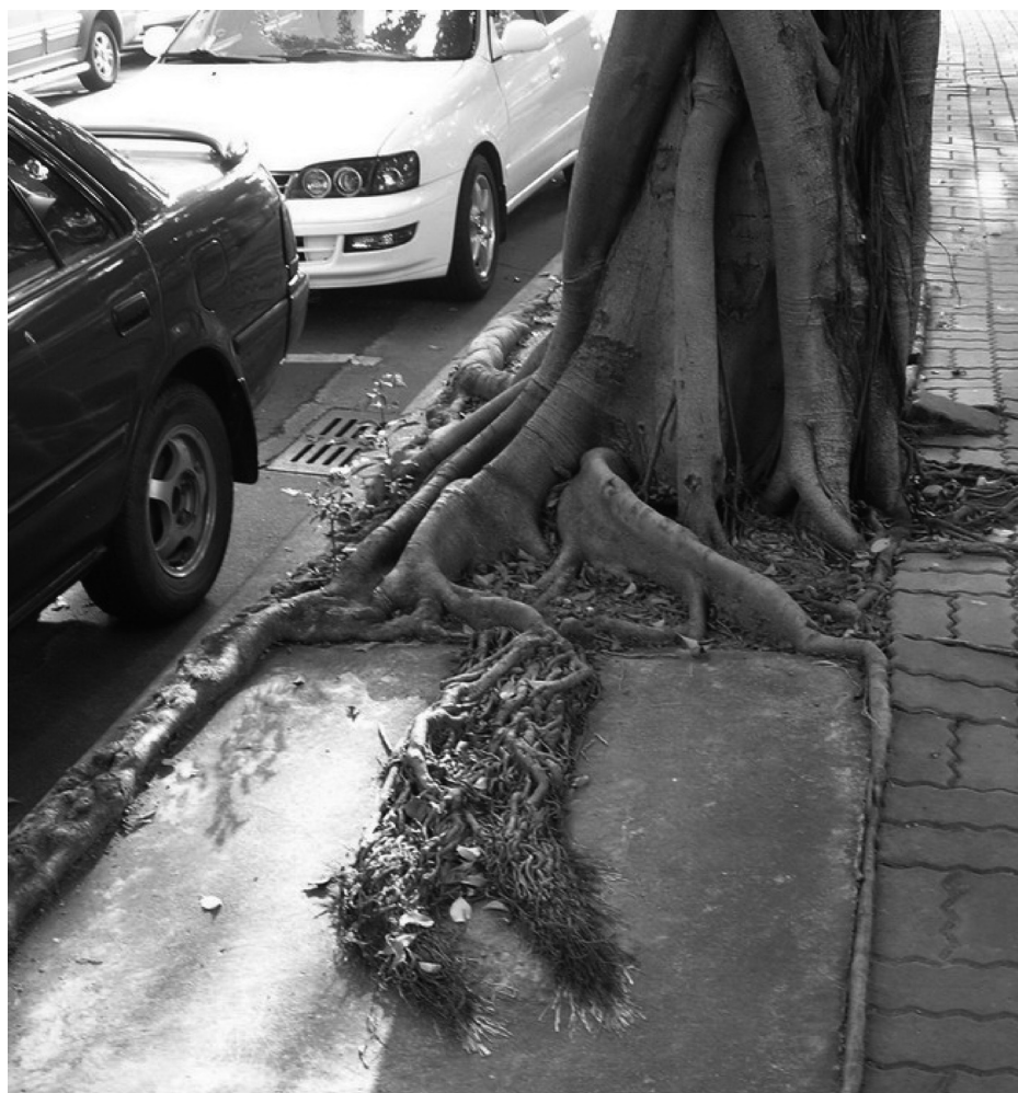
圖1. 垂榕根系長出植穴外

垂榕進行1次調查，時間為2008年5月03~25日。人行道植栽穴內緣的土壤高度與其鄰近之植穴外之鋪面高度的差異，可能是高突、相同或凹陷的，經多年觀察與初步勘查，發現當植穴內緣之土壤與植穴外之鋪面高度相同或高突時，垂榕之地表根當伸長至植穴內緣時，多會超過植穴並向外之鋪面伸展，而不會於植穴內形成環根，見圖1；但當植穴內之土壤較植穴外之鋪面低時，垂榕之地表根當伸長至植穴邊緣時，多會於植穴內緣形成環根，見圖2。基於此初步調查所發現之現象，想藉由實地調查，驗證植穴內緣環根形成與植穴內外高差之間具相關性。同一個植穴內各處之土壤並非都是相同的高度，植穴內之土壤可能是傾斜的，因此針對每一個於植穴內緣形成的環根，同時調查與該環根相鄰處之土壤高差，共分7級，鋪面高度較穴內土壤低2cm、相同、高2cm、高4cm、高6cm、高8cm、以及高10cm以上。調查不同高差分級形成環根之數量，再計算佔全體環根之比率，並進一步將高差與形成環根之平均比率進行Pearson相關分析，探討其間之關係。