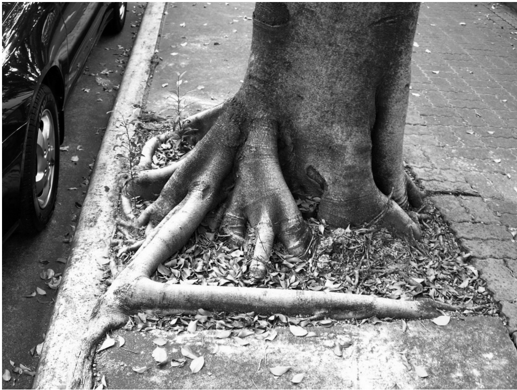
圖2. 垂榕於植穴內緣形成環根