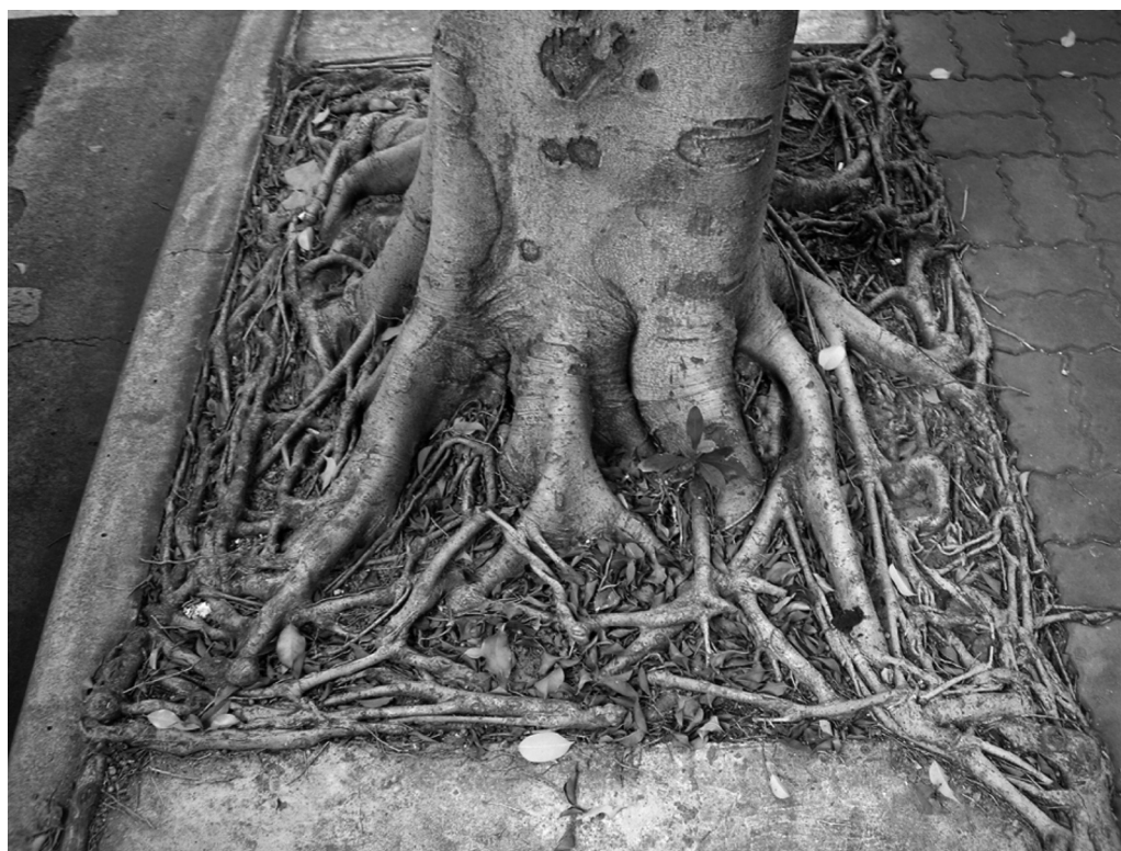
圖5. 植穴內已形成如網狀般的環根