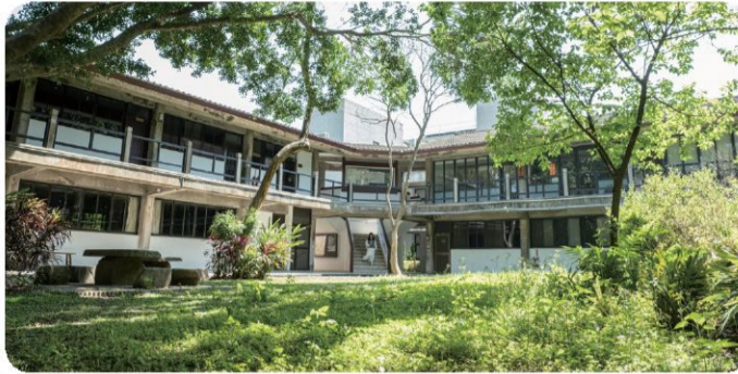
景觀系館專屬中庭