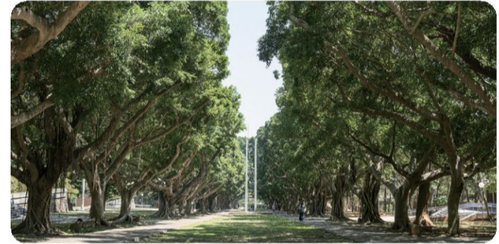
東海校園 文理大道