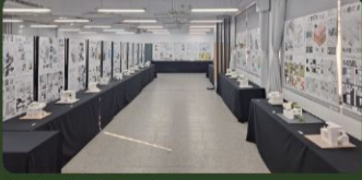
全系期末教學成果展