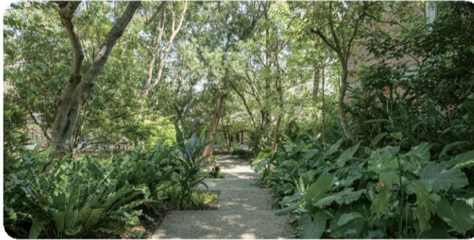
景觀系館專屬前庭步道