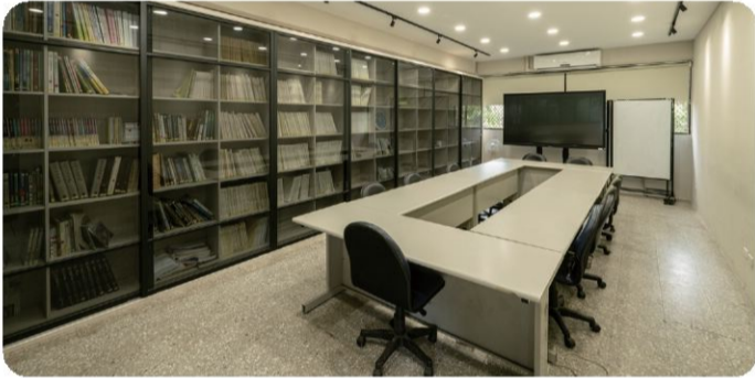
景觀系多功能研討室 研討室C