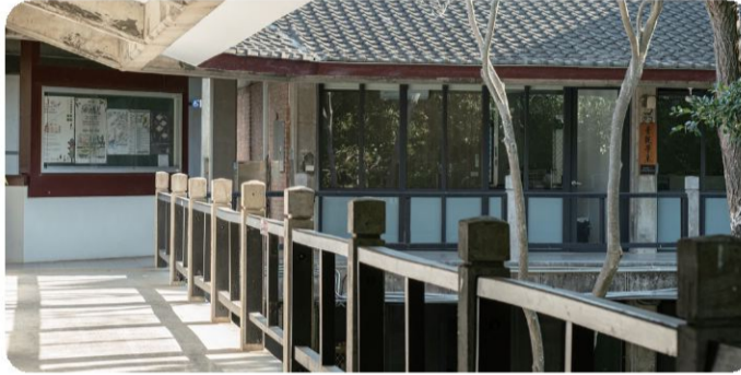
景觀系館走廊空間