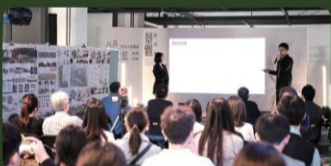
10校景觀系畢業設計 聯合評圖