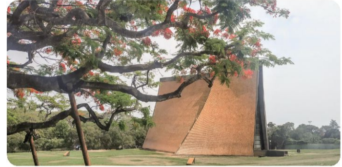
東海校園 路思義教堂