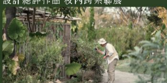
景觀植物學 校外教學