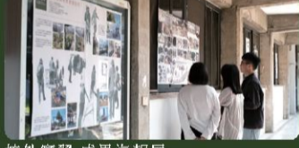
校外實習 成果海報展