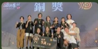
大專生洄游農村競賽 銅獎頒獎典禮