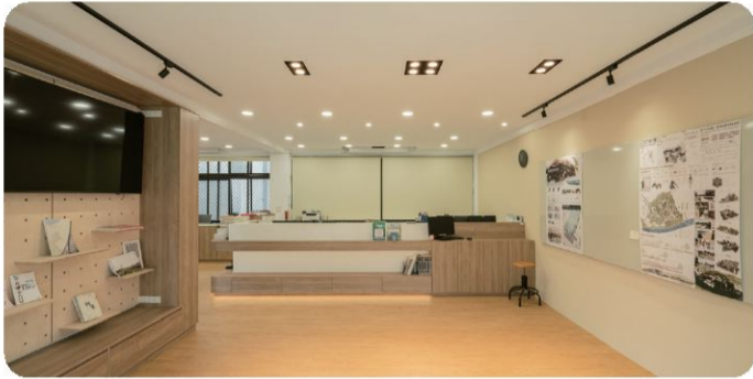
景觀系辦公室空間 LA204