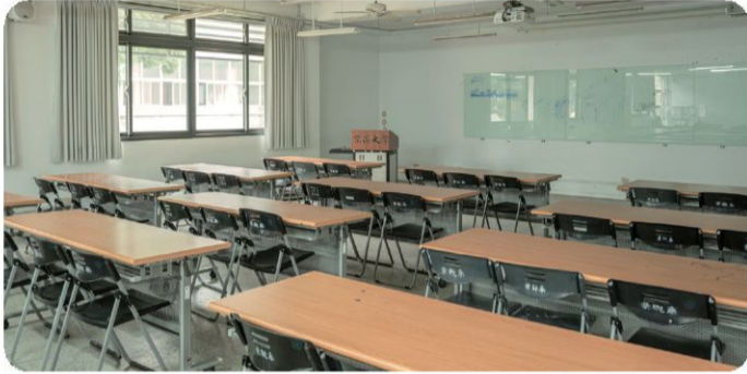
景觀系多功能大教室 LA109