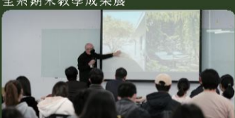
國際研討會 主題演講