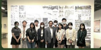
設計總評作品 校內跨系聯展