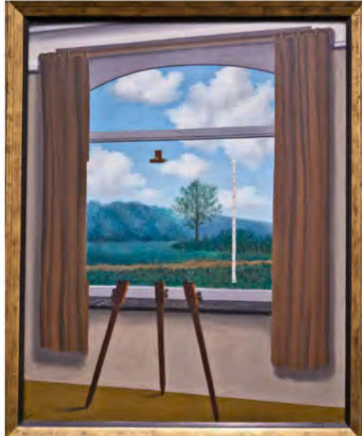
La condition humaine, 1933: Rene Magritte

D. W. Meinig, "Axioms for Reading the Landscape" (1979)