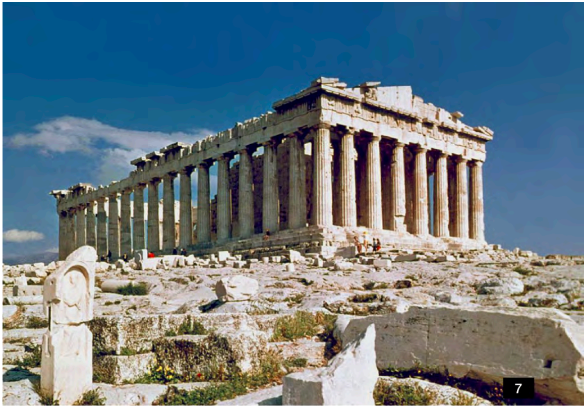
Parthenon, Athen, 447-438 BCE 帕德嫩神廟，雅典