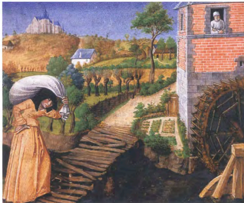
56 The miller, his mill house and his property, from René d'Anjou, Mortification de vainc plaisance , c. 1470.

Eric Wolf, Europe and People of No History (1983)